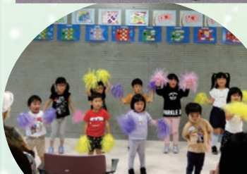
院内保育所「たんぼぼ」